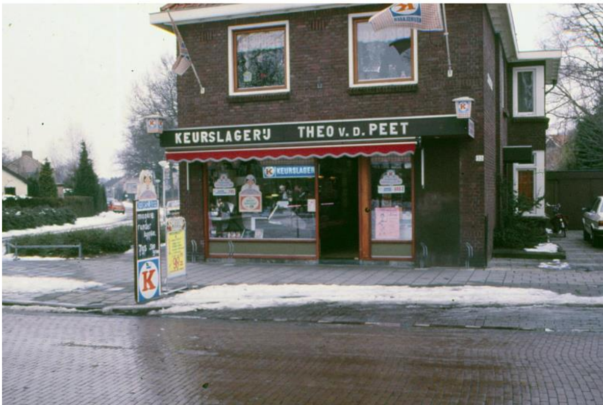
De slagerij in 1985