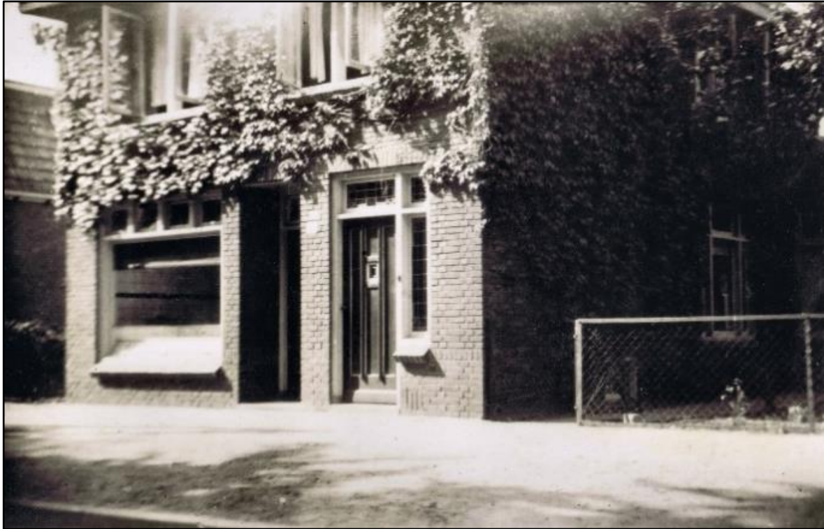
De slagerij in 1946