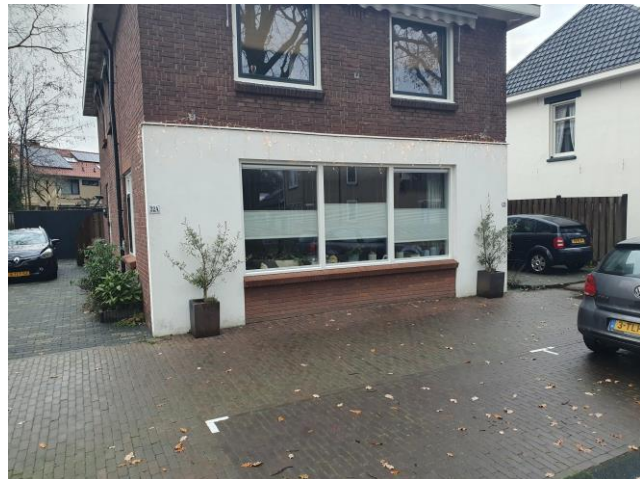
Met dit als resultaat