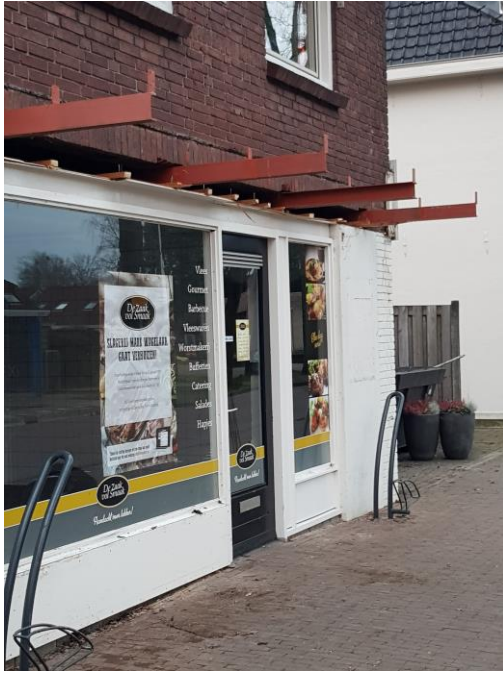
Van winkel .....