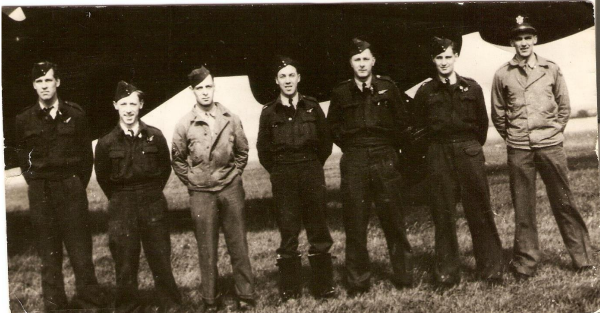
De vaste bemanning van Halifax DK 259 "L".