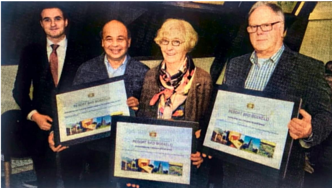
Prijsuitreiking in januari 2015