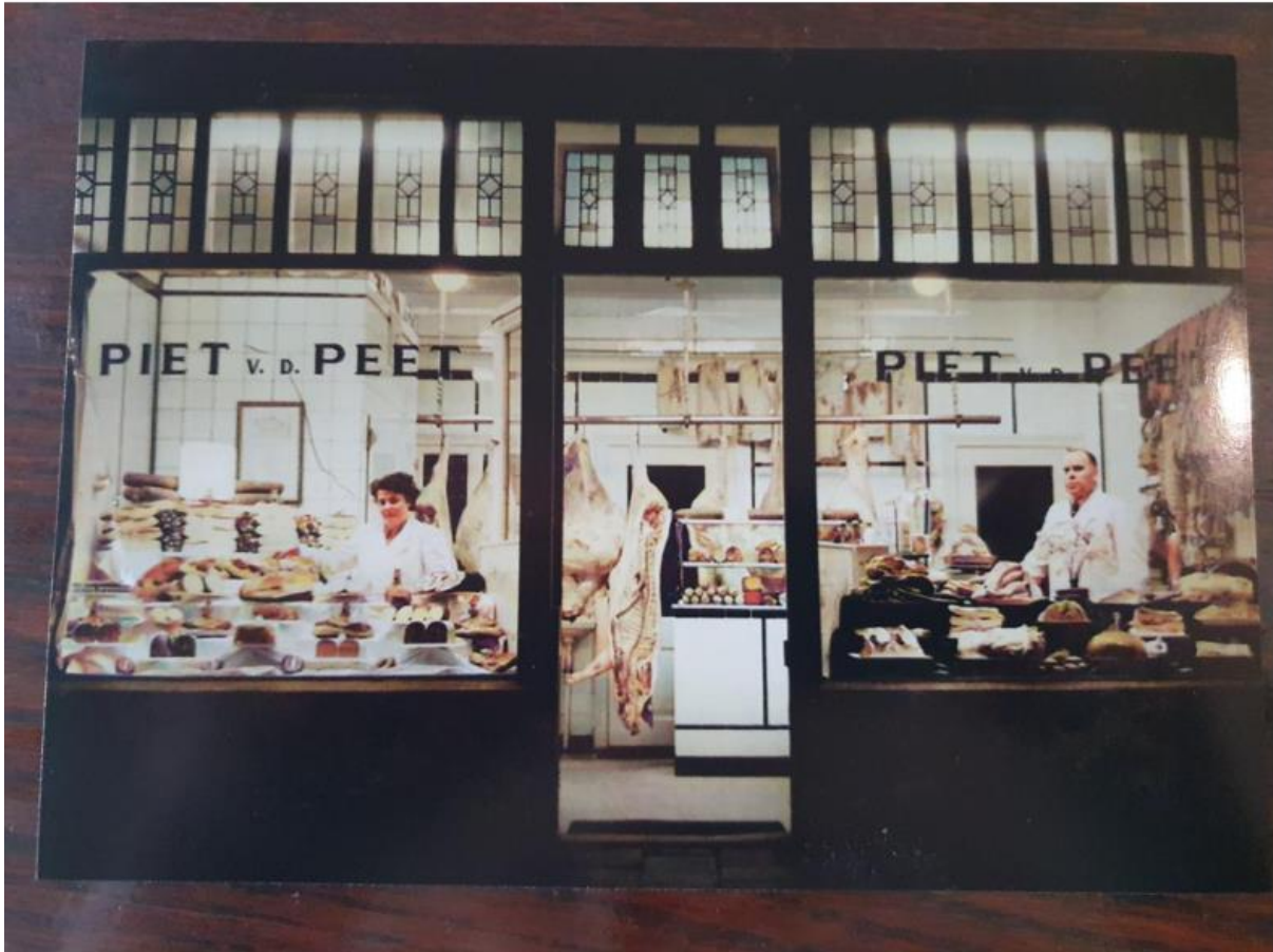
De slagerij van Theo's ouders in Nijmegen in 1955

Een voorbeeld van zo'n slagerij is die van Piet van der Peet in Nijmegen.