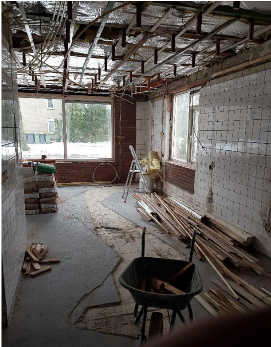
De winkel werd totaal gestript

Zij maakten van de voormalige slagerij hun woonhuis waarvan de verbouwing op 1 februari 2021 startte. Op de begane grond hoefde geen muur afgebroken te worden maar die werd wél totaal gestript.